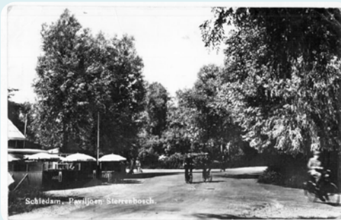
Paviljoen "Sterrebosch" (1957)