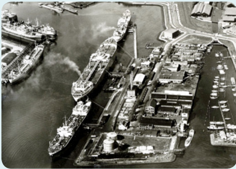
Luchtfoto: De N.V. Tankercleaning aan de Havenstraat.