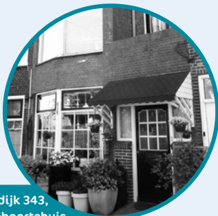
Vlaardingerdijk 343, Maartens geboortehuis. Foto gemaakt in 2019.