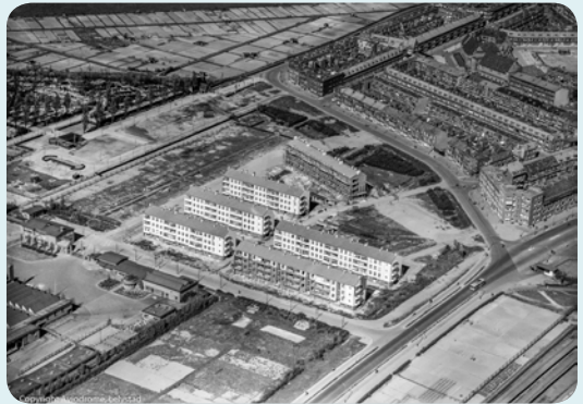
De nieuwbouw in de Slachthuisbuurt. Met rechtsboven de Vlaardingerdijk en het gat dat in de bebouwing ontstond door het bombardement op 14 april 1943. Hierdoor verhuisde de familie naar het Van 't Hoffplein.